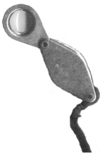
Lille lup, der forstørrer 10 gange