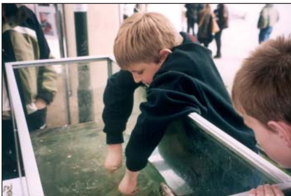
Fisk fra Peblinge Sø på Miljøfestival 2003