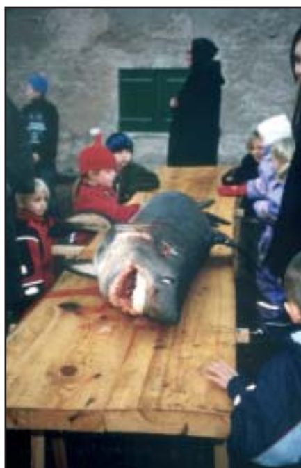
Haj på Øresundsmiljøskolen