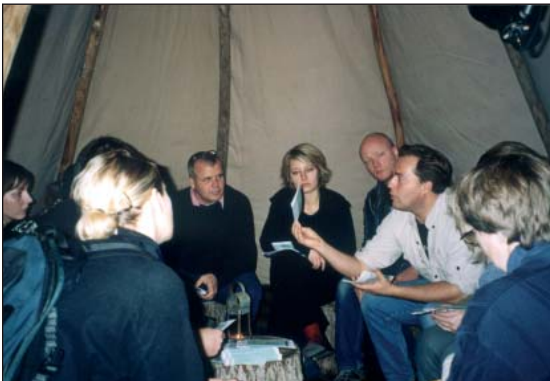
Introdage i Rådhushallen

Også de nye lærere og pædagoger og andre interesserede i København havde mulighed for at lære Miljøtjenesten at kende ved november måneds „Intro for nye lærere og pædagoger“ i Rådhushallen. Her kunne de besøgende høre om de mange tilbud, Miljøtjenesten har til Københavns børn og unge indenfor miljøformidling. Kulisserne var hentet fra efterårets store arrangement „Skeletter i Parken“ og gav de besøgende mulighed for at samle et helt menneske af skeletdele eller lege arkæologer for en dag, mens de gravede i en køkkenmødding efter dyreknogler.