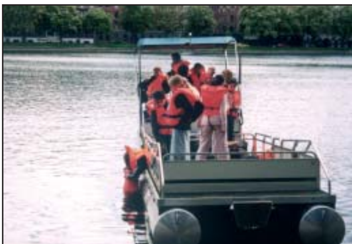
Hvad mon der er dernede?

I løbet af 2003 blev konceptet for et Affaldsværksted færdigt. Det skete i et samarbejde med R98 og Amagerforbrænding. Beslutningen om at realisere Affaldsværkstedet ligger nu i de to selskabers bestyrelser.