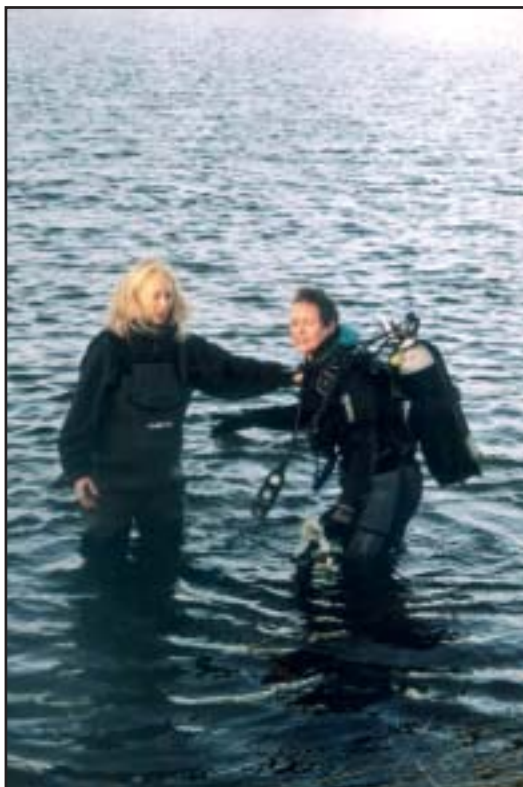
I vandet på Øresundsmiljøskolen