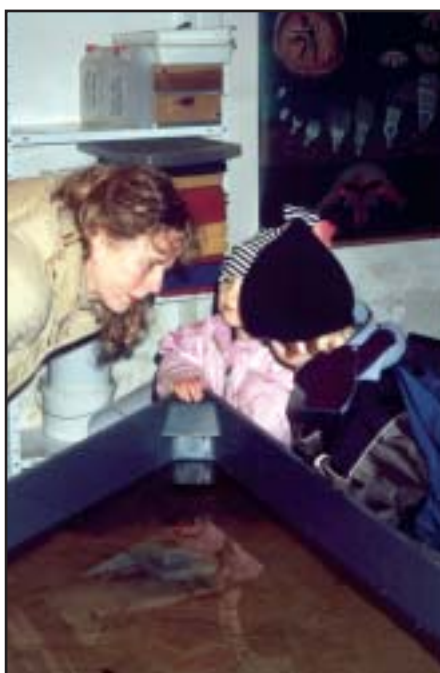
Åbningen af Øresundsmiljøskolen