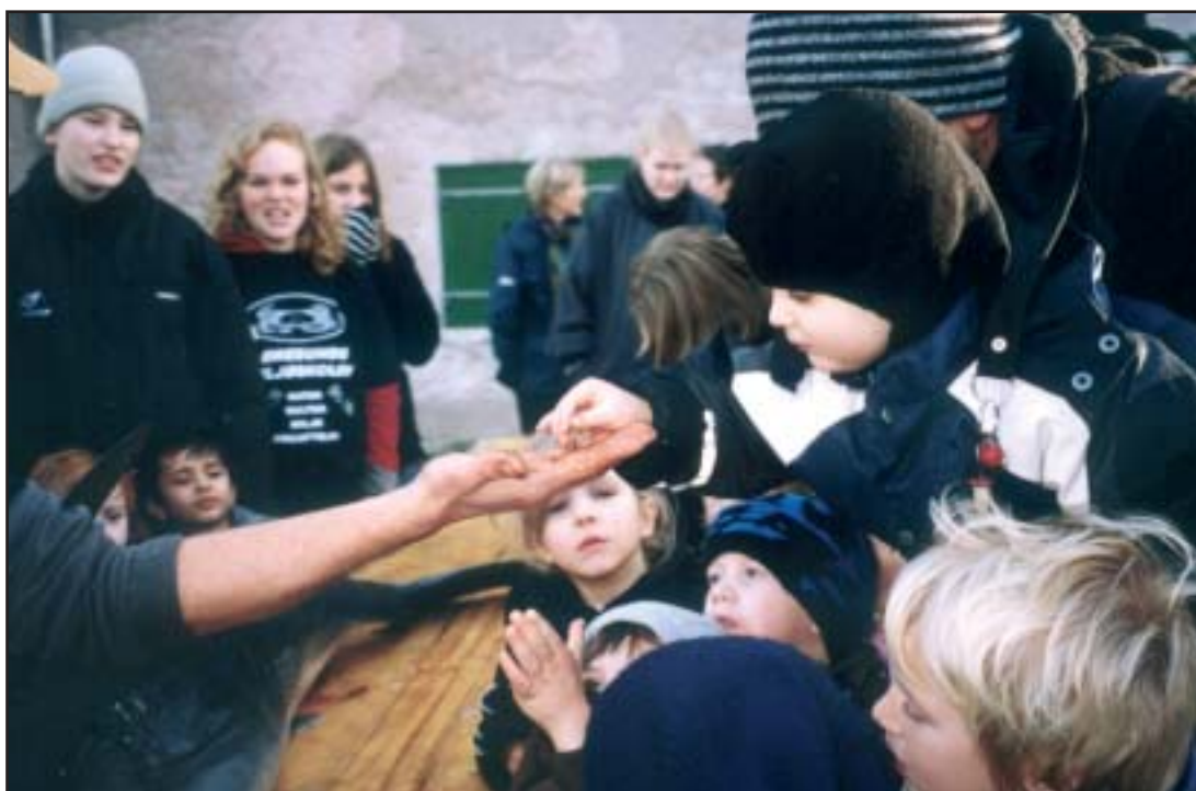
Hajens øje undersøges nærmere