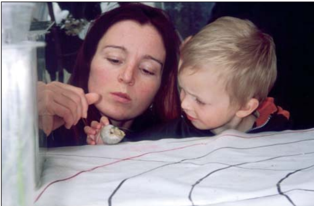
Mor og barn undersøger en snegl på Miljøfestival 2003