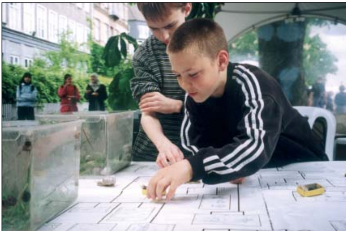
Natur/teknik forsøg på Miljøfestival 2003

I forbindelse med de større undervisnings- og formidlingsaktiviteter Miljøtjenesten deltager i eller er initiativtager til, vil der som hovedregel være knyttet en eller flere samarbejdspartnere, der finansierer hele eller betydelige dele af udviklings- og driftsudgifterne. Som eksempel kan nævnes samarbejdet med Københavns Energi vedrørende Energi- og Vandværkstedet i Valby.