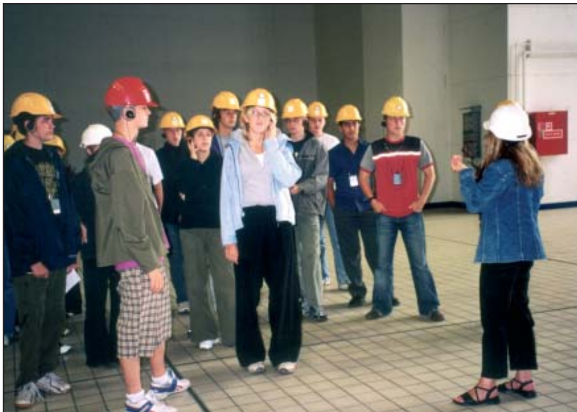
Rundvisning på en miljøinstitution