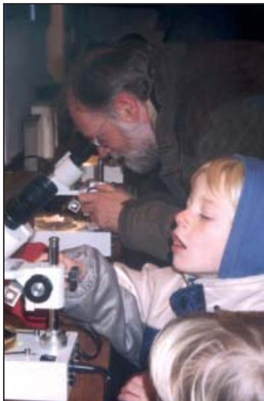
Prøverne studeres nærmere