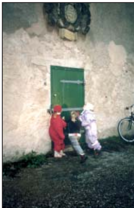
Børnehavebørn ved Øresundsmiljøskolens åbning

Målet for 2004 er, at de tre miljøskoler ved årets udgang har afviklet 130 - 140 besøg, der alle som udgangspunkt giver børn og voksne spændende oplevelser, der inspirerer til yderligere fordybelse inden for området natur og miljø hjemme i institutionen.