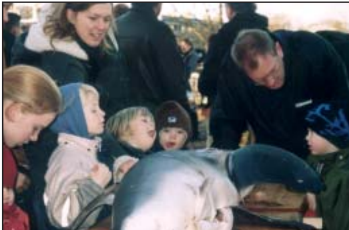
Hajen undersøges nærmere