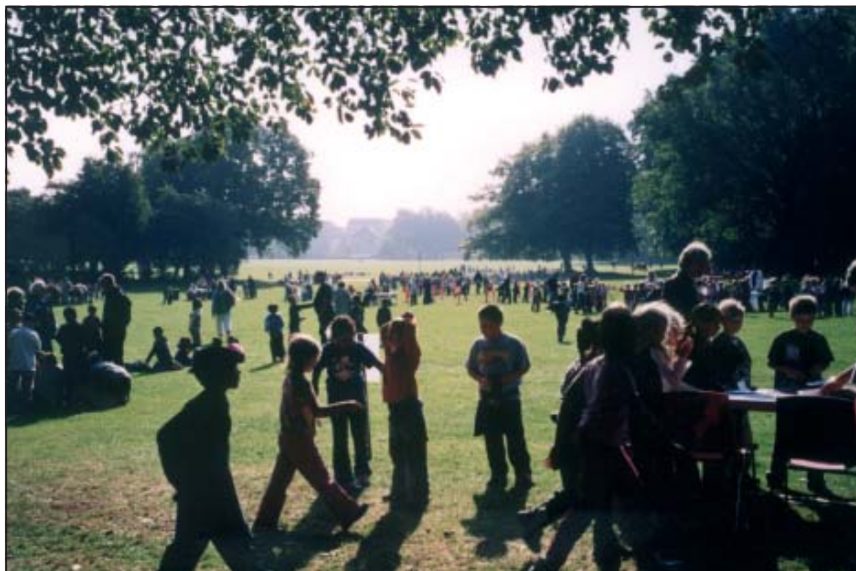
4000 elever til stort arrangement i Fælledparken

Projekterne, som Øresundsmiljøskolen har planer om at tilslutte sig, vil give udbytte på flere planer. De vil medvirke til kvalitetsudvikling, styrkelse af samarbejde og erfarings- og vidensudveksling. De vil fremme borgerinddragelse i plan- og naturbeskyttelsesarbejde og medvirke til bæredygtig udvikling i det nordisk-baltiske område.