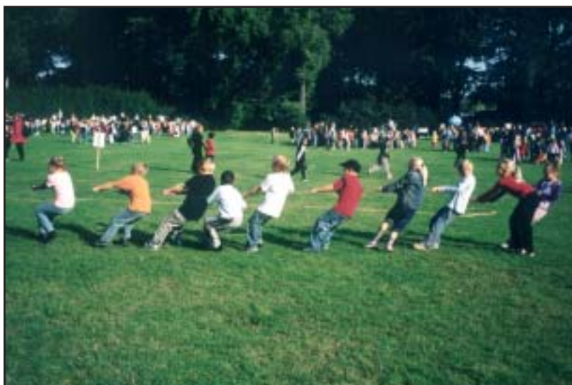
Så skal der trækkes til

Efter jordudskiftningens stille år, er besøgstallene atter på vej op. Besøgende børn i 2003: Ca. 5.500. Besøgende voksne i 2003: Ca. 2.500.