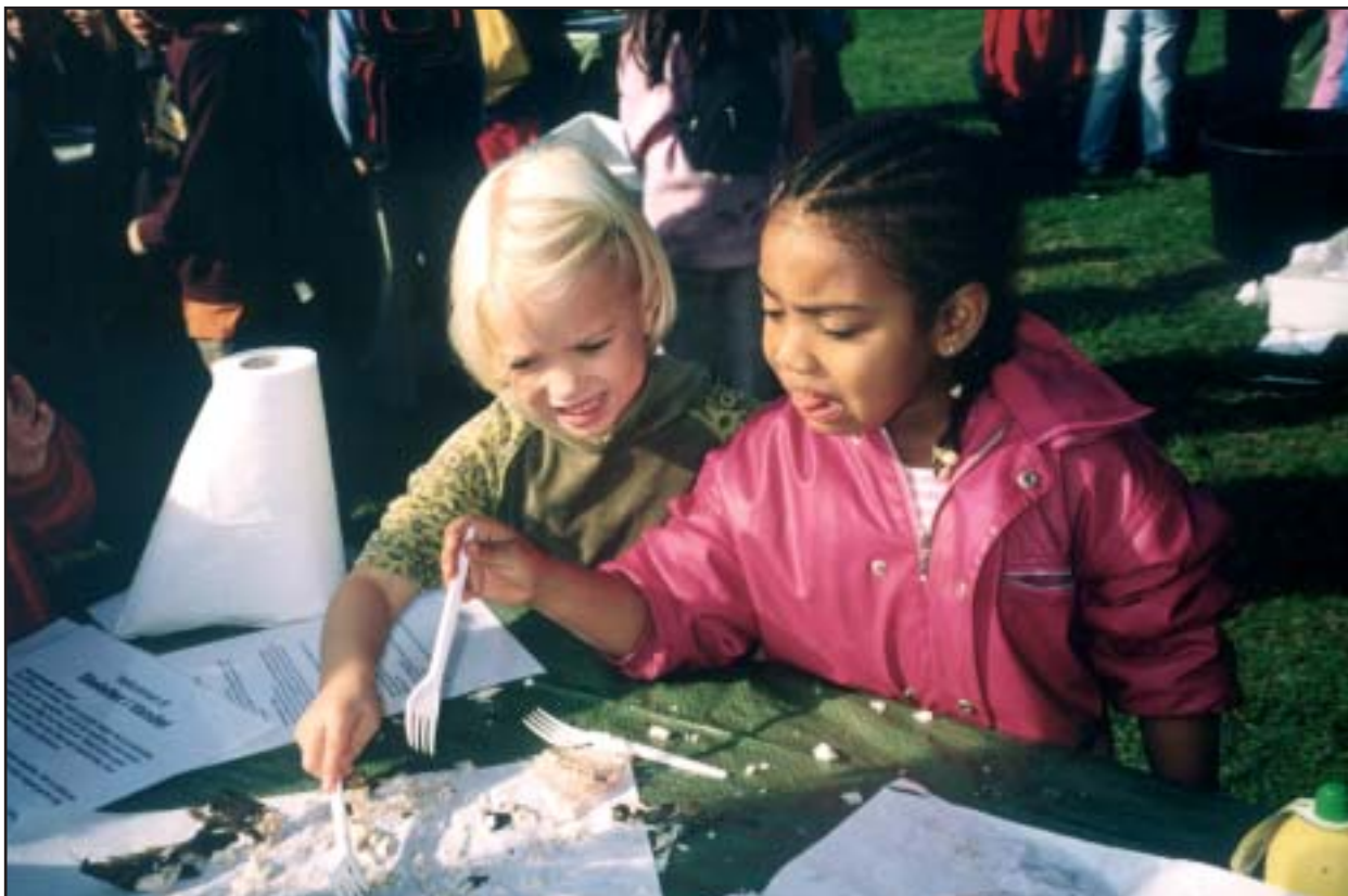
Æv, jeg fik et fiskeben i munden