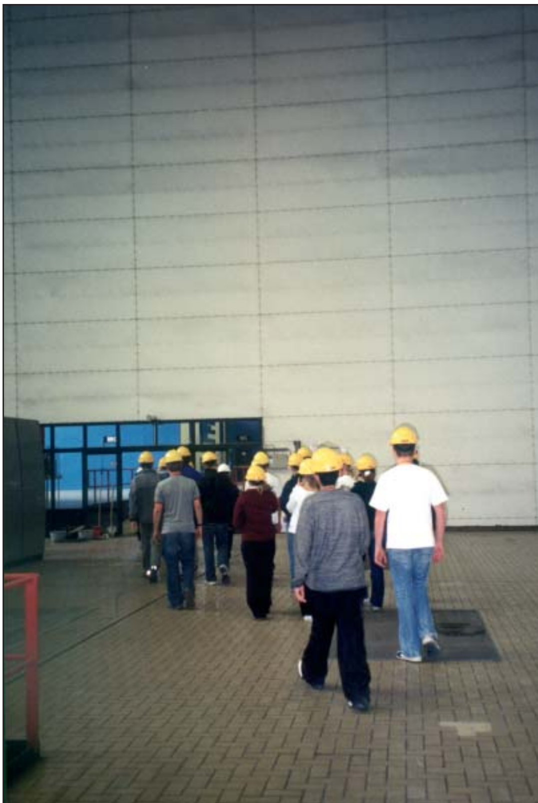
Et klassebesøg på Amagerværket