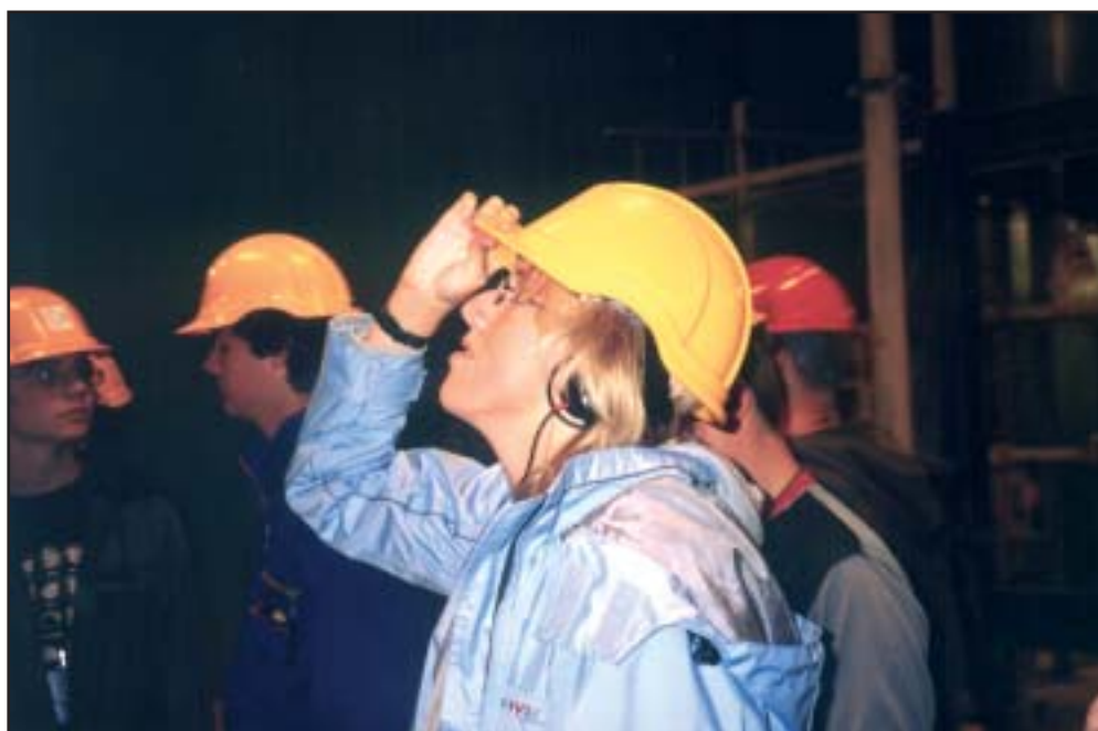
Sikkerheden skal være i orden

Når pilotprojektet på fritidsinstitutionerne i Vanløse afsluttes i foråret 2005, har Miljøtjenesten skabt et koncept, som resten af Københavns skoler og fritidsinstitutioner kan blive certificeret efter. Dermed har Miljøtjenesten taget et stort skridt i retning mod indførelse af miljøledelse i kommunens institutioner, som det er nævnt i Dogme 2000 samarbejdet.