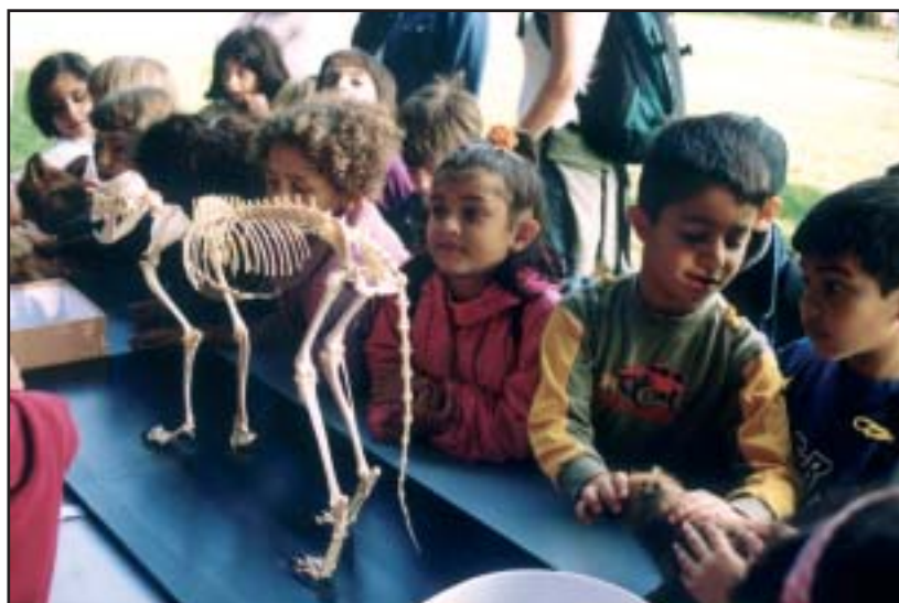
Ræven, indvendigt og udvendigt

Gennem et tættere og mere forpligtende samarbejde mellem miljøområdet og institutions- og uddannelsesområdet kan de samlede ressourcer til formidling i forhold til børn og unge anvendes mere hensigtsmæssigt og med større effekt i forhold til målgruppen.